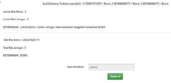
Gambar 3. Hasil Klasifikasi Penerapan Algoritma K- NN

Dari gambar diatas dapat dilihat bahwa algoritma K-NN menerapkan perhitungan jarak Ecludian Distance yang menghasilkan tiga nilai tetangga terdekat dengan data uji dengan nilai secara urut sebagai berikut 1.79, 1.89, dan 1.89 dengan label data secara urut adalah bisnis, bisnis, dan bisnis. Dari data diperoleh hasil tiga data yang kesemuanya masuk pada kelas bisnis dan tidak ada (nol) satupun yang masuk kelas jaringan. Jumlah kelas bisnis dengan jumlah sama dengan tiga lebih banyak daripada kelas jaringan dengan jumlah nol sehingga hasil klasifikasi data uji tersebut yaitu “BISNIS”.