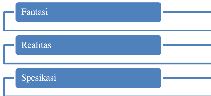
Gambar 7. Sub Tahapan Pilihan Pekerjaan

Masing-masing individu perlu memahami diri mereka masing-masing seperti halnya dunia pekerjaan untuk memilih pilihan yang berarti. Hal ini berarti individu perlu memahami kebutuhannya, kemampuannya, minatnya dan karakteristiknya. Individu perlu memiliki pengetahuan mengenai perbedaan pekerjaan dan persyaratan yang perlu dipenuhi untuk dapat bekerja dengan baik.