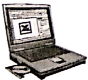
Screen: penggunaan Excel untuk mencari t-hitung

Komputer mempermudah pekerjaan pengujian parsial ini. Pada output hasil regresi sudah tercantum secara otomatis nilai t-hitung. Kita hanya memerlukan nilai t-tabel sesuai dengan derajat bebas dan taraf nyatanya. Suatu variabel akan berpengaruh nyata apabila nilai t-hitung lebih besar dari t-tabel ( t\text{-hitung} > 2,36 ) atau lebih kecil dari negatif t-tabel ( t\text{-hitung} < -2,36 ). Dengan memperhatikan kondisi tersebut, maka dengan mudah dapat dilihat bahwa b_1 tidak berpengaruh nyata terhadap Y dan b_2 berpengaruh nyata terhadap Y .