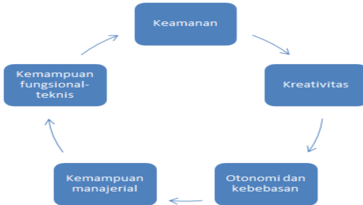
Gambar 11. Jenjang Karir ( Career Anchors )

Ada lima perbedaan motif dasar karir yang menjelaskan jalan bagi orang-orang untuk memilih dan mempersiapkan karirnya, di mana mereka menyebutnya sebagai jangkar karir ( career anchors ) yaitu antara lain: