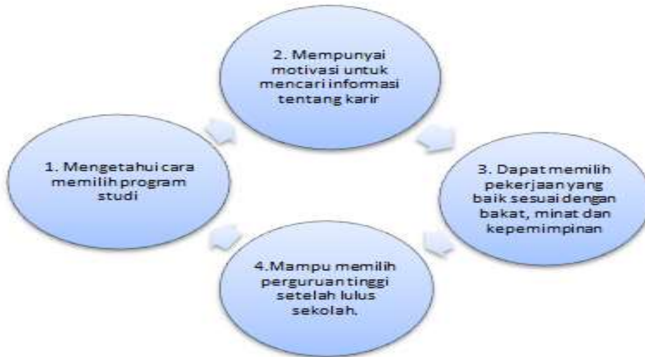
Gambar 9. Ciri –Ciri Perencanaan Karir