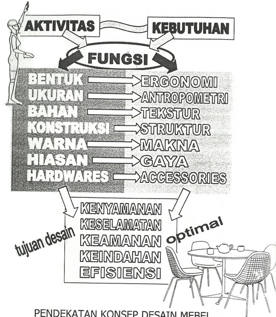
PENDEKATAN KONSEP DESAIN MEBEL