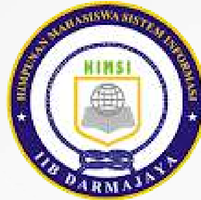
Himpunan mahasiswa Sistem Informasi