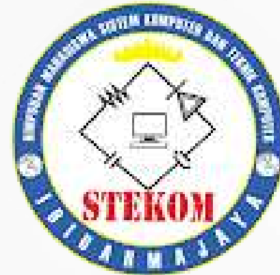
Himpunan mahasiswa Sistem Komputer