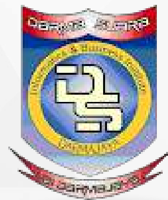
Unit Kegiatan Mahasiswa Darma Suara