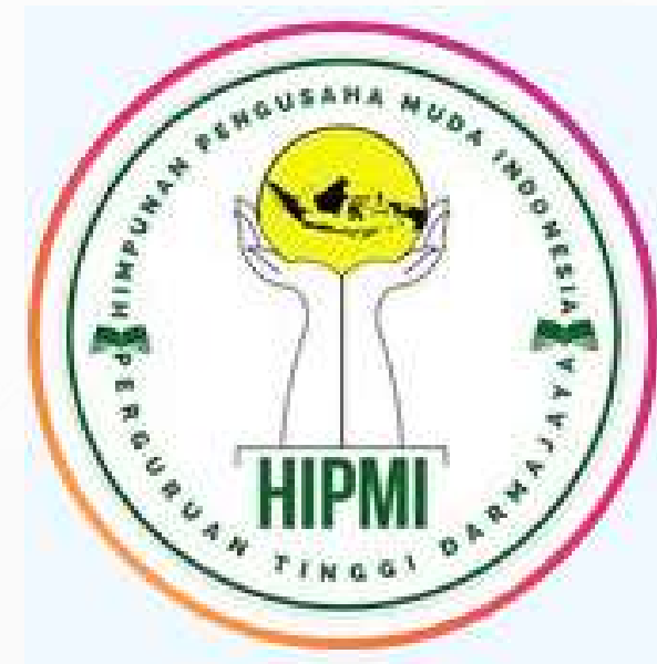
HIPMI PT Darmajaya