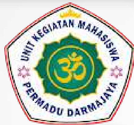
Unit Kegiatan Mahasiswa Perhimpunan Mahasiswa Hindu