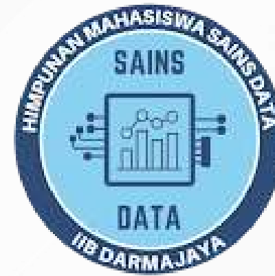
Himpunan mahasiswa Sains Data