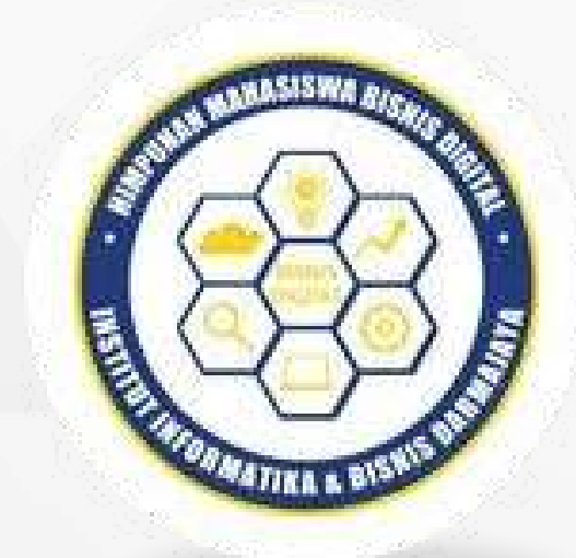
Himpunan mahasiswa Bisnis Digital