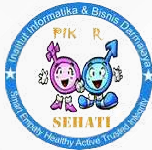
PIK Remaja SEHATI