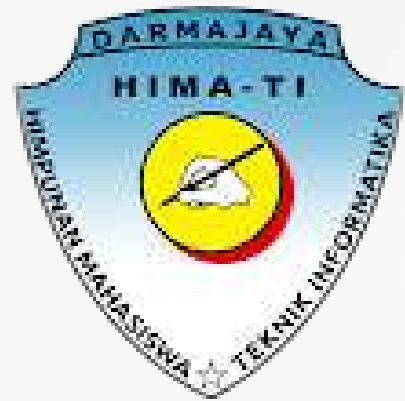
Himpunan mahasiswa Teknik Informatika

adalah organisasi kemahasiswaan di tingkat jurusan yang beranggotakan mahasiswa jurusan yang bersangkutan.