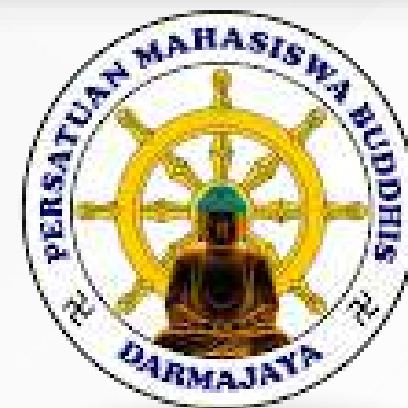
Unit Kegiatan Mahasiswa Persatuan Mahasiswa Buddhis