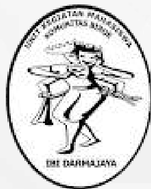
Unit Kegiatan Mahasiswa Komunitas Biroe