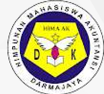
Himpunan mahasiswa Akuntansi