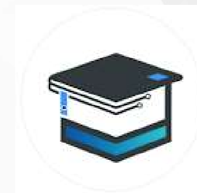
Himpunan mahasiswa Pendidikan Teknologi Informasi