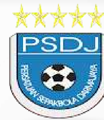
Unit Kegiatan Mahasiswa Persatuan Sepakbola Darmajaya