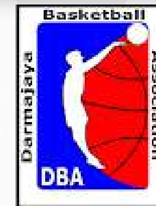
Unit Kegiatan Mahasiswa Darmajaya Basketball Association