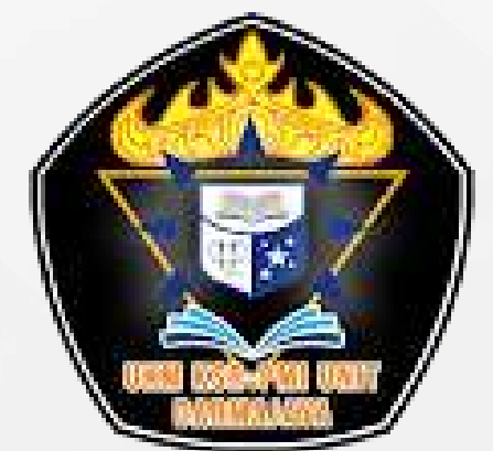
Unit Kegiatan Mahasiswa Korps Suka Relu Darmajaya