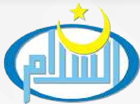
Unit Kegiatan Mahasiswa As Salam

adalah organisasi atau kelompok di perguruan tinggi yang fokus pada kegiatan ekstrakurikuler dan minat khusus di luar kurikulum akademik. UKM berfungsi sebagai wadah bagi mahasiswa untuk berkolaborasi, mengembangkan keterampilan, minat, dan bakat mereka berkreasi, dan berpartisipasi dalam kegiatan yang mendukung pengembangan pribadi dan sosial mereka