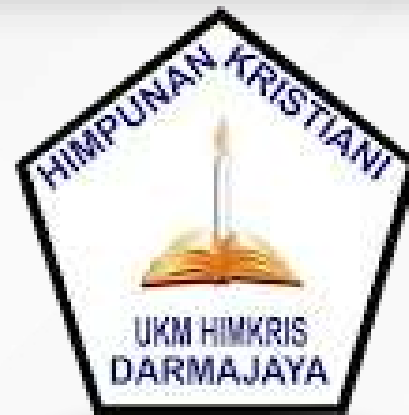
Unit Kegiatan Mahasiswa Himpunan Kristiani