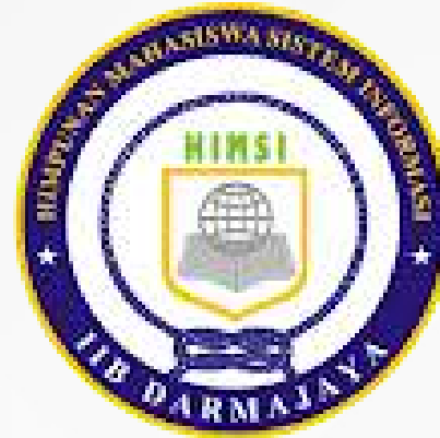
Himpunan mahasiswa Sistem Informasi