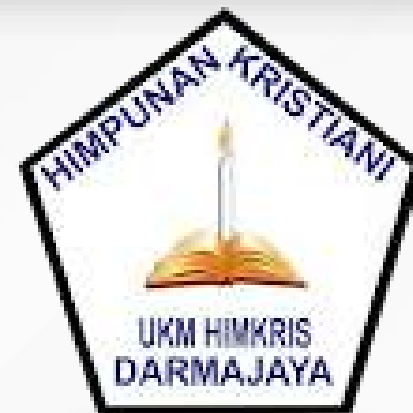
Unit Kegiatan Mahasiswa Himpunan Kristiani