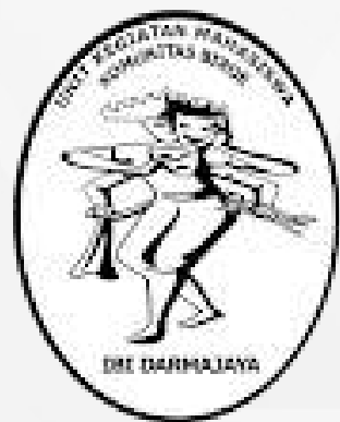
Unit Kegiatan Mahasiswa Komunitas Biroe