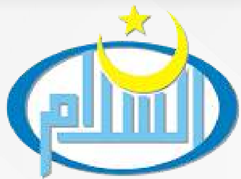
Unit Kegiatan Mahasiswa As Salam

adalah organisasi atau kelompok di perguruan tinggi yang fokus pada kegiatan ekstrakurikuler dan minat khusus di luar kurikulum akademik. UKM berfungsi sebagai wadah bagi mahasiswa untuk berkolaborasi, mengembangkan keterampilan, minat, dan bakat mereka berkreasi, dan berpartisipasi dalam kegiatan yang mendukung pengembangan pribadi dan sosial mereka