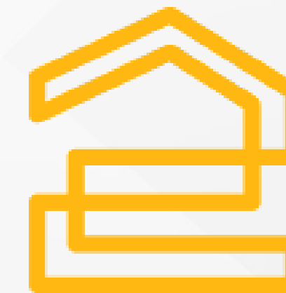
Himpunan mahasiswa Desain Interior