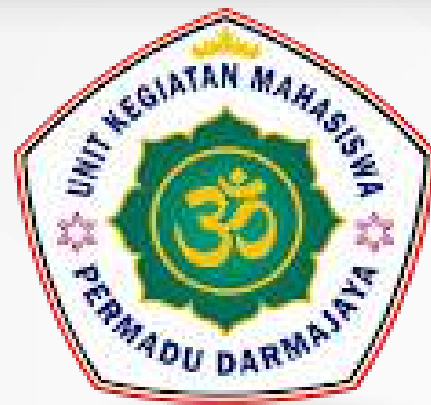
Unit Kegiatan Mahasiswa Perhimpunan Mahasiswa Hindu