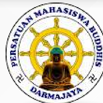
Unit Kegiatan Mahasiswa Persatuan Mahasiswa Buddhis