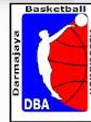
Unit Kegiatan Mahasiswa Darmajaya Basketball Association