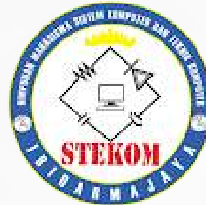
Himpunan mahasiswa Sistem Komputer