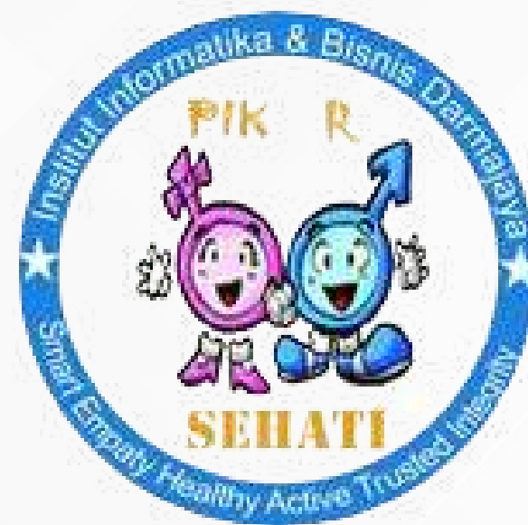
PIK Remaja SEHATI