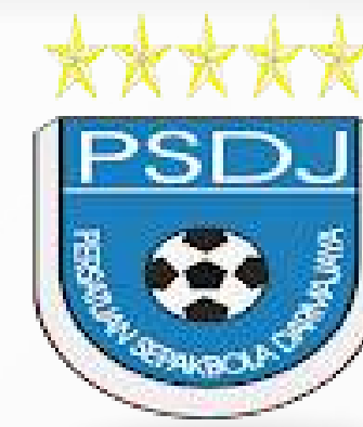
Unit Kegiatan Mahasiswa Persatuan Sepakbola Darmajaya