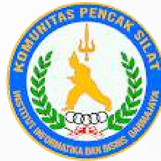
Komunitas Mahasiswa Pencak Silat Darmajaya