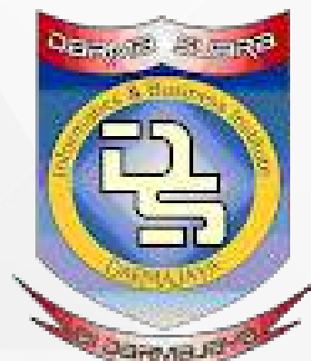
Unit Kegiatan Mahasiswa Darma Suara