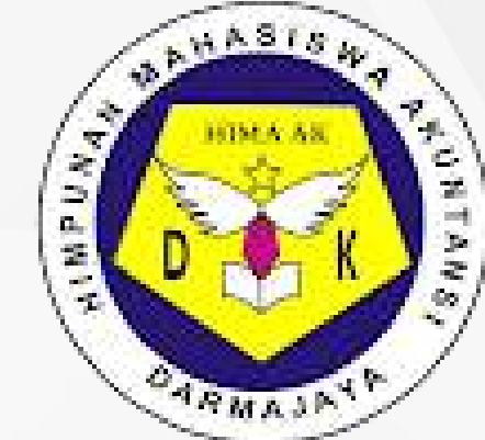
Himpunan mahasiswa Akuntansi