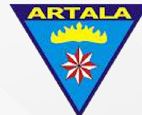
Unit Kegiatan Mahasiswa Darmajaya Pecinta Alam