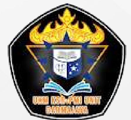
Unit Kegiatan Mahasiswa Korps Suka Relu Darmajaya