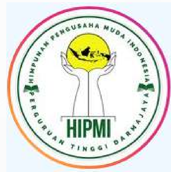
HIPMI PT Darmajaya