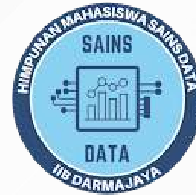
Himpunan mahasiswa Sains Data