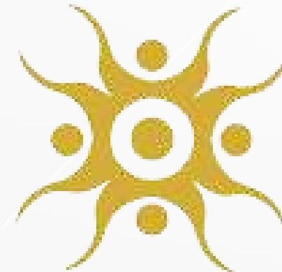
Himpunan mahasiswa Desain Komunikasi Visual