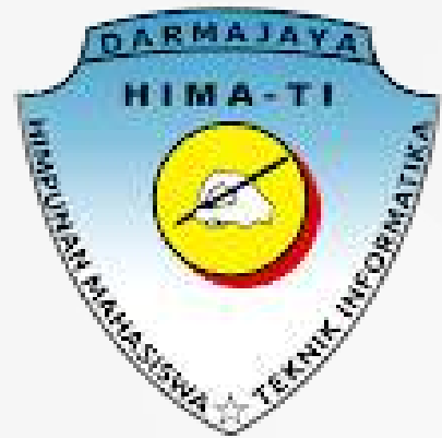
Himpunan mahasiswa Teknik Informatika

adalah organisasi kemahasiswaan di tingkat jurusan yang beranggotakan mahasiswa jurusan yang bersangkutan.