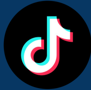
Tik Tok Ads