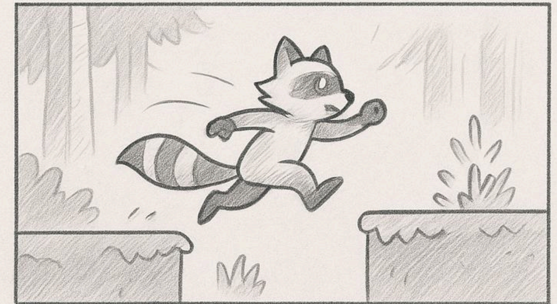
LEVEL 1 – AWAL PETUALANGAN