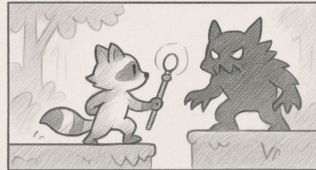
After a thousand years, raccoon awoke... the forest had lost its light.