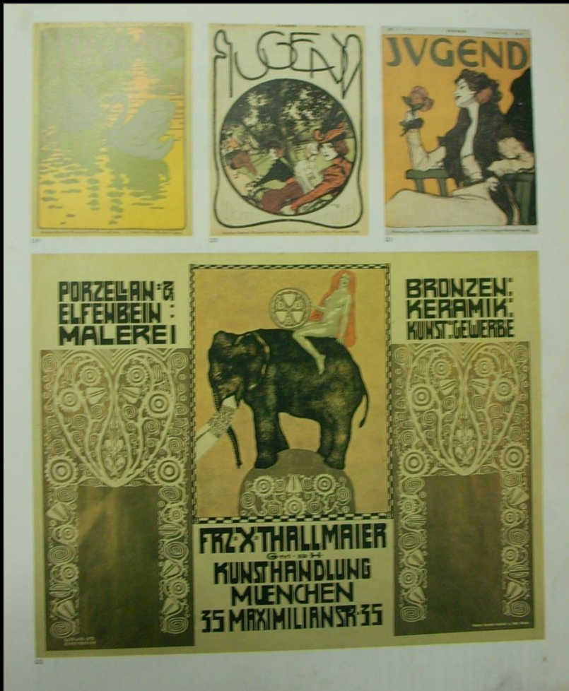
ART NOUVEAU/ JUGENSTIL (1890-1910)