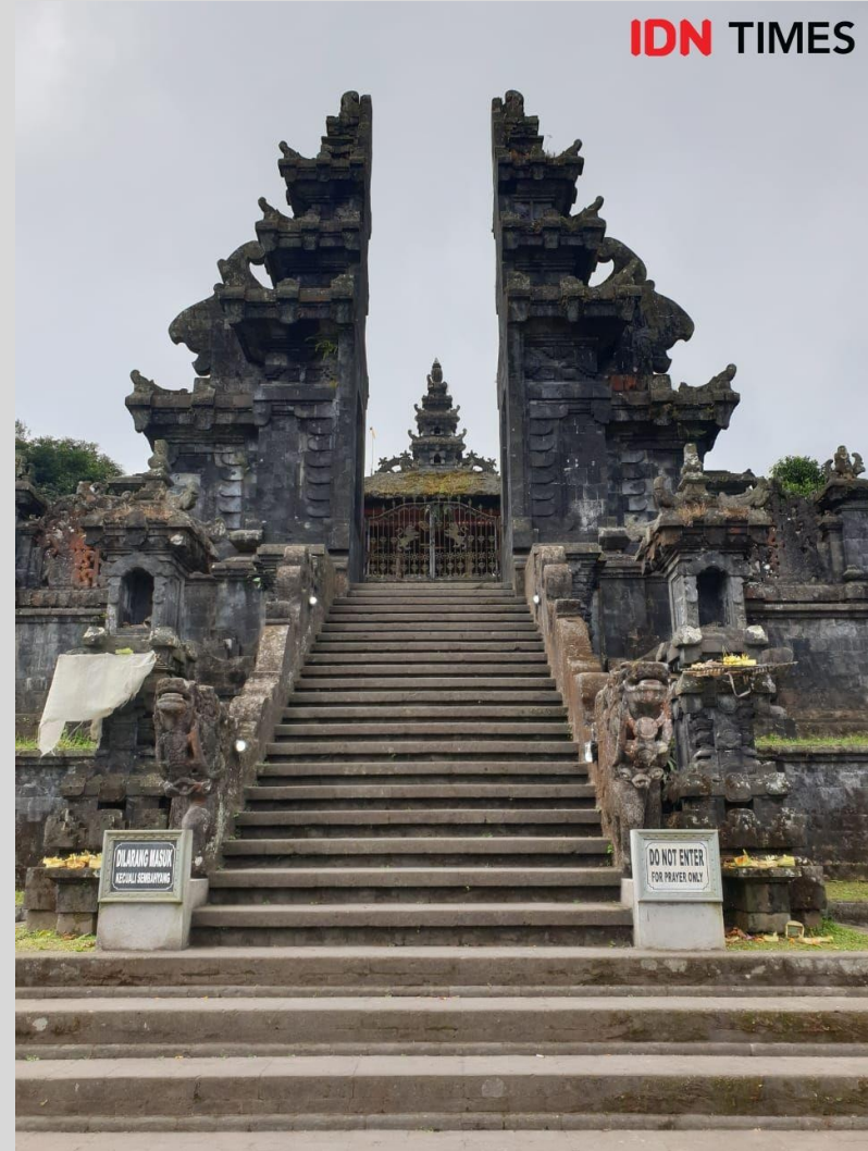
Gapura pada rumah tradisonal Bali