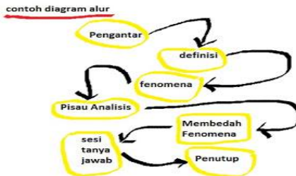
Gambar 3.1: Diagram Alur Mematri

Kasus pertama di atas adalah pemateri tingkatan beginner (pemula). Seorang calon pemateri harus pernah mendengarkan materi tersebut, berdiskusi, menyusun alur, dan mempersiapkan referensi sebelum membawakan materinya. Kasus kedua di atas adalah pemateri tingkatan intermediate (menengah) dan expert (mahir). Seorang pemateri yang sudah sering membawakan materi lain, hendaknya menyusun diagram alur materi yang sama sekali belum pernah ia bawakan. Hal ini memudahkan sistematika pembawaan materi nantinya. Berikut contoh diagram alur.