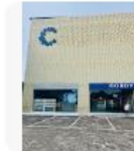
CORDY STORE LAMPUNG