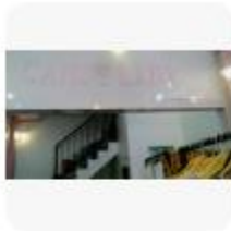
Candy Lady Store